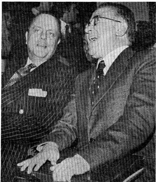
Como amigos El ex ministro de Franco Manuel Fraga hizo reír ayer al hasta hace poco exiliado Santiago Carrillo, poco antes de intervenir los dos en el Club Siglo XXI. Los representantes de los extremos de las fuerzas parlamentarias (fascistas y comunistas) parecen cercenarse de los ataques que recíprocamente se dirigieron en la campaña electoral. Fraga presentó a Carrillo en la fuera tribuna de la clase política franquista y ésta aceptó al eurocomunista. Un acto y una imagen más de la reconciliación. Pág. 16-17.