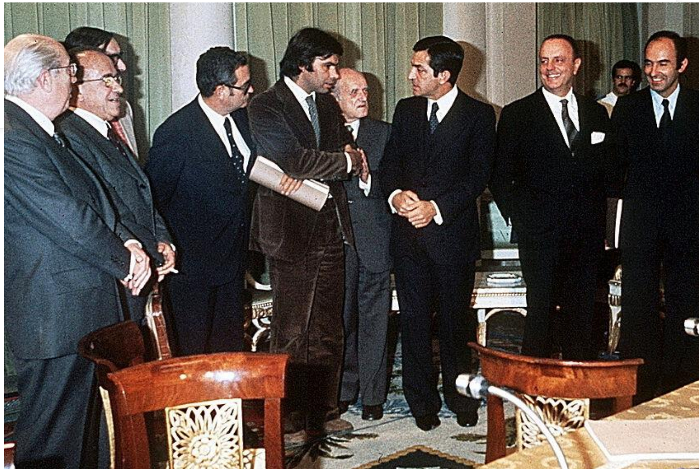
Els "Pactos de la Moncloa", signats el 25 d'octubre de 1977, van aconseguir reunir en una mateixa fotografia a Miquel Roca (CiU), Manuel Fraga (AP), Adolfo Suárez (UCD), Felipe González (PSOE) i Santiago Carrillo (PCE), entre d'altres.