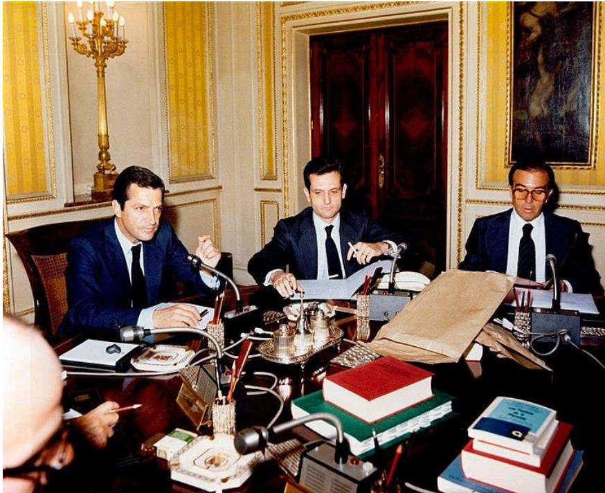
Adolfo Suárez president de la reunió del Consell de Ministres (maig de 1980).

El Govern de la UCD no va saber reaccionar ni prendre mesures eficaces per pal·liar la situació econòmica ni els seus efectes sobre la població. No es va atrevir a repercutir l'augment del preu del cru als consumidors i va intentar assumir-ho des del pressupost, amb la caiguda de la recaptació d'impostos als carburants.