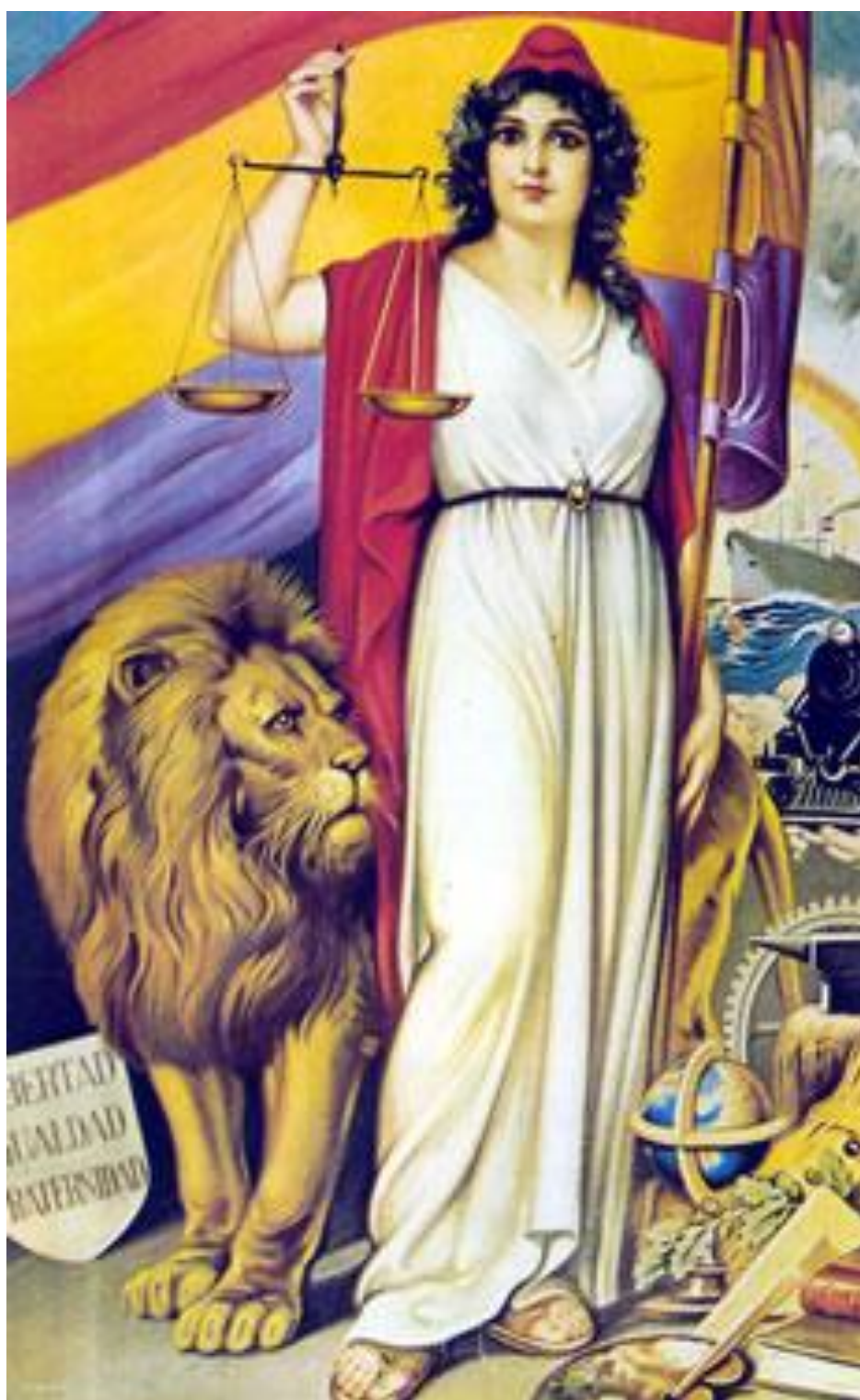
Allegoría de la República