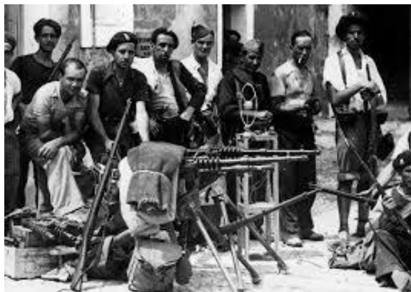
La cèlebre “Columna de Ferro”, formada per anarcosindicalistes valencians, coneguda pels estralls i abusos que va cometre quan intentava imposar el “comunisme llibertari”.

Es va formar un poder “de facto”, no controlat per les institucions legítimes de la República, que va substituir els Ajuntaments, el Govern de la Generalitat i de fet al mateix Estat.